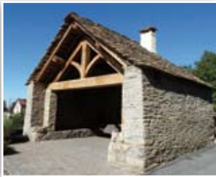
Le four de Leyrieu, un des premiers éléments du petit patrimoine restauré (CDRA, 2012).

L'action 2.4 du Contrat de Développement Rhône-Alpes - « inventaire, préservation et mise en valeur des différents types de patrimoine bâti rural », intéresse directement chacune des communes, qui peut ainsi bénéficier d'aides pour préserver, restaurer et faire connaître les éléments de son patrimoine. La Maison du patrimoine de Hières-sur-Amby et la Maison de la Pierre au Ciment de Montalieu-Vercieu accompagnent le SYMBORD pour la mise en œuvre de cette action.