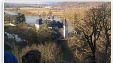
Le sentier thématique de Vertrieu a été aménagé en 2012. Il sera inauguré à l'occasion de la Fête du patrimoine, le 1 er week-end de juin.

La création de sentiers thématiques et de routes touristiques permet aussi de partager le patrimoine, à l'image des projets de sentier de la Pierre, de routes des peintres, de sentier sur le patrimoine industriel du bassin de la Bourbre, ou encore du parcours